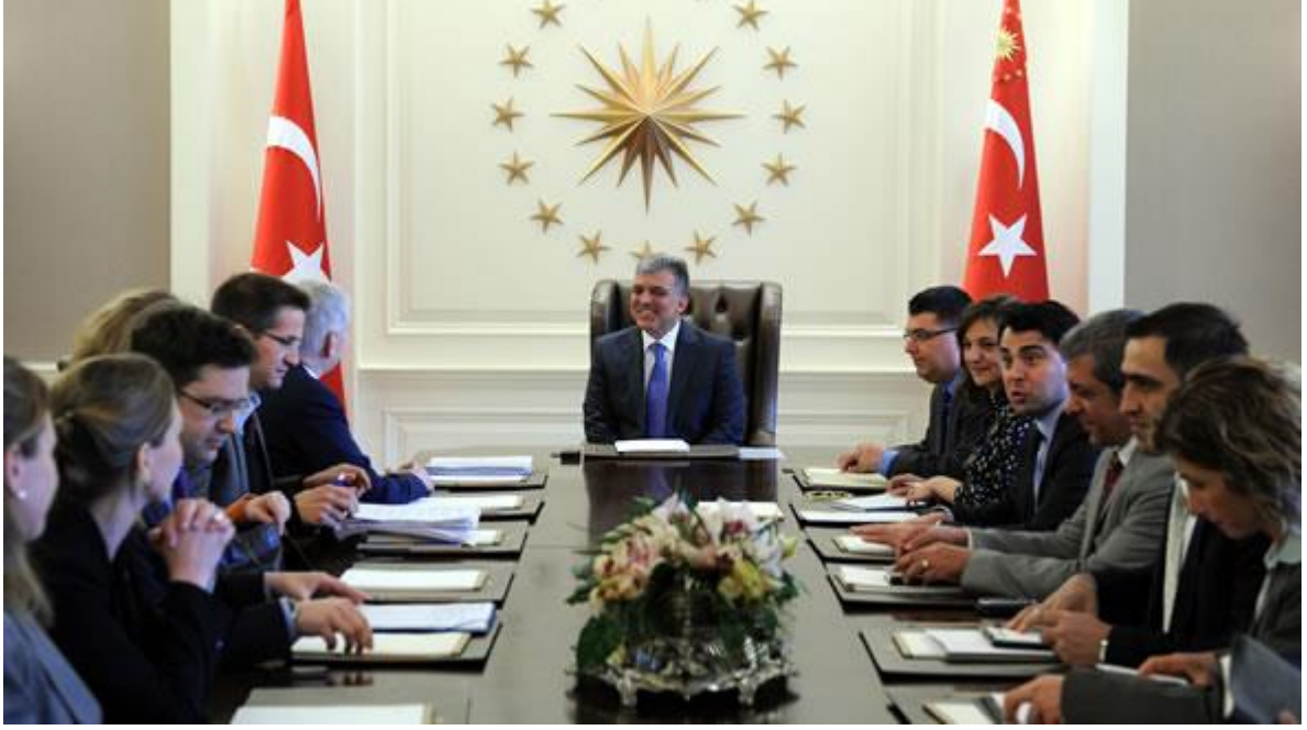
ESI Beyaz Liste Projesi Grubu ve Stiftung Mercator'un Cumhurbaşkanı Gül ile Görüşmesi

ESI, vize serbestleşmesi konusunda 2006'dan beri çalışıyor.