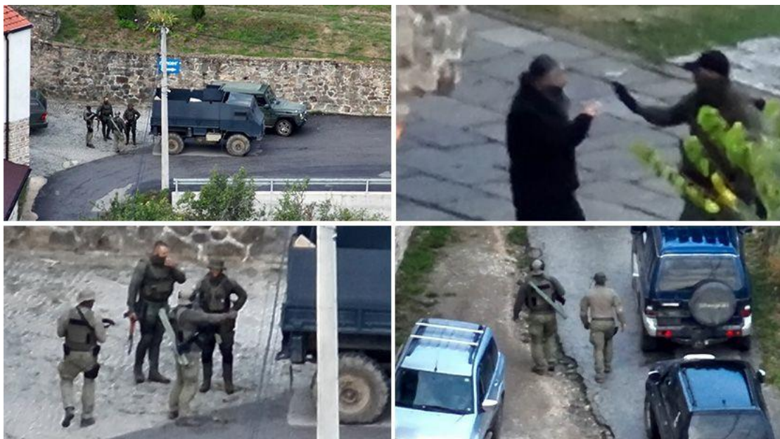
Rückkehr der serbischen Paramilitärs in den Norden des Kosovo, 24. September 2023

Und doch sind solche Lügen gefährlich. Am 6. Juli 2023 erklärte der serbische Präsident Aleksandar Vucic öffentlich, dass die NATO und die UN vierzehn Tage Zeit hätten, um die Polizeikräfte des Kosovo zu entwaffnen und die Kosovo-Serben vor den laufenden albanischen „Pogromen und ethnischen Säuberungen“ zu schützen. Andernfalls müsse dies „jemand anderes“ tun. Das Fehlen von Beweisen hat nicht verhindert, dass solche aufwiegenden Behauptungen aufgestellt werden. Mit der Erfindung von Verbrechen wie der „systematischen Vertreibung“ rechtfertigt der serbische Präsident präventiv eine serbische Militärintervention im Kosovo zum „Schutz der Serben“. Wo Pogrome erfunden werden, folgt meist Gewalt.