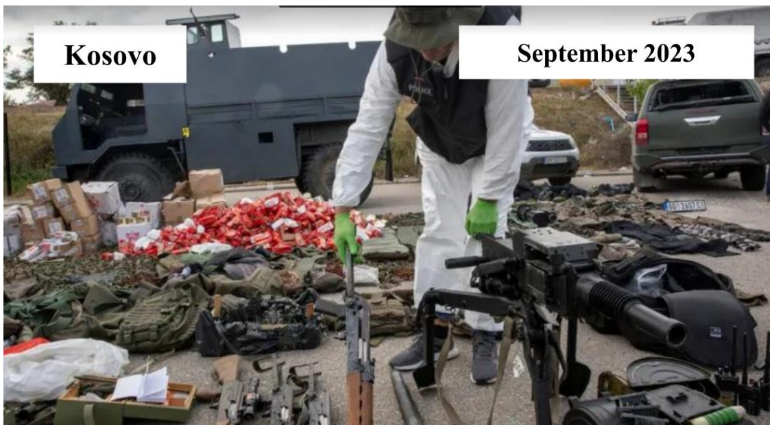
Am 24. September 2023 im Norden des Kosovo beschlagnete Waffen

Die Drohungen aus Serbien hatten sich seit Monaten verschärft. Im vergangenen Sommer, am 14. Juni 2023, entführten Spezialeinheiten der serbischen Polizei drei Beamte der kosovarischen Grenzpolizei und hielten sie zwölf Tage lang gefangen. Am 23. Juni stoppte die kosovarische Polizei im Norden des Kosovo ein serbisches Auto mit Waffen. Am 24. September 2023 griffen schwer bewaffnete serbische Paramilitärs die kosovarische Polizei im Norden des Kosovo an und töteten einen Polizisten. Die serbischen Paramilitärs verbarrikadierten sich daraufhin im orthodoxen Banjska-Kloster. Bei dem Schusswechsel mit der kosovarischen Polizei wurden drei der Angreifer erschossen.