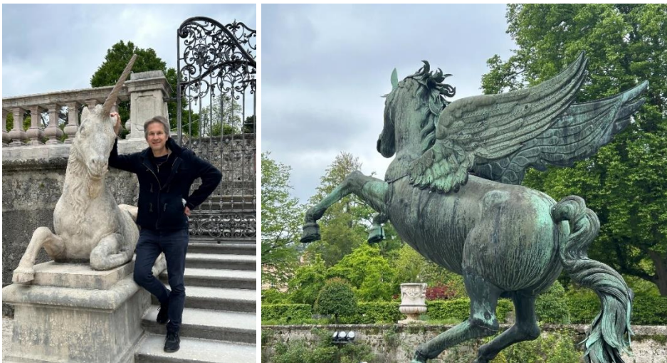
Fantastische Tierwesen – Vucics ASM: etwas, das nirgendwo existiert