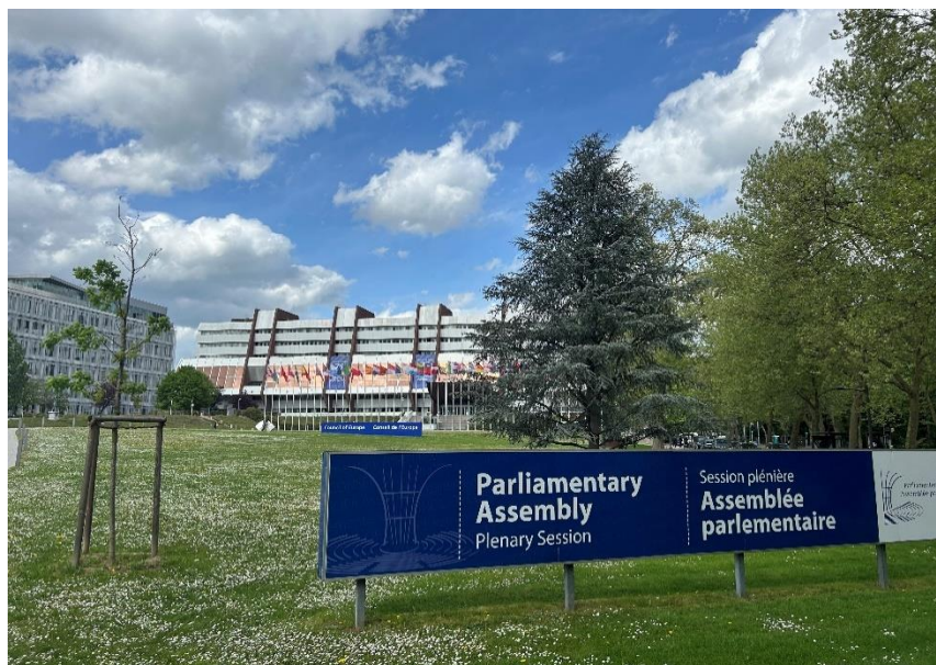
Straßburger Entscheidung zum Kosovo , 15. April 2024

Nach dem Durchbruch von Decani und dieser Verpflichtungserklärung fand am 27. März eine erste historische Abstimmung im PACE-Ausschuss für politische Angelegenheiten in Paris statt. Hier stimmten 31 Mitglieder des PACE-Ausschusses für den Bakoyannis-Bericht, der die Aufnahme des Kosovo in den Europarat empfahl. Nur 4 stimmten dagegen (zwei aus Serbien, je einer aus Montenegro und Bosnien und Herzegowina).