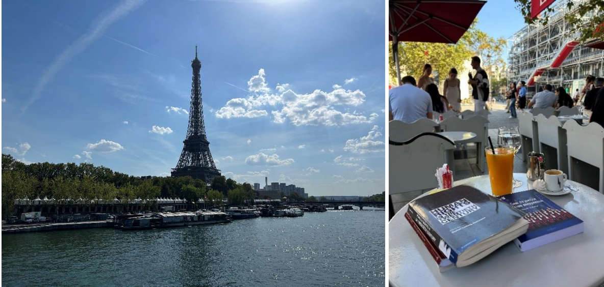
Pariser Beschluss zum Kosovo , 27. März 2024

Nach dem Durchbruch von Decani und dieser Verpflichtungserklärung fand am 27. März eine erste historische Abstimmung im PACE-Ausschuss für politische Angelegenheiten in Paris statt. Hier stimmten 31 Mitglieder des PACE-Ausschusses für den Bakoyannis-Bericht, der die Aufnahme des Kosovo in den Europarat empfahl. Nur 4 stimmten dagegen (zwei aus Serbien, je einer aus Montenegro und Bosnien und Herzegowina).