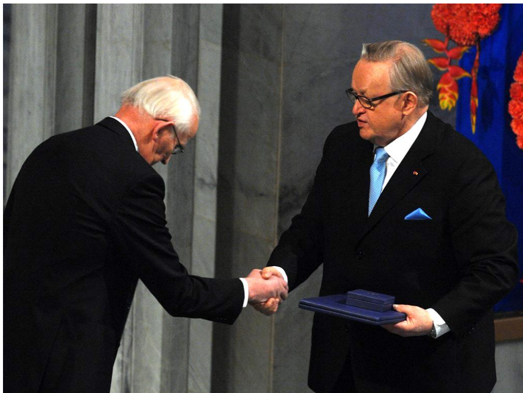
Der große Vermittler und sein Preis

Am 22. März 2024 verpflichtete sich die Staatsführung des Kosovo in der Liste der Verpflichtungen für die Zeit nach dem Beitritt , „ substanzielle und greifbare Schritte zu unternehmen, um alle Artikel des Brüsseler Abkommens und des Abkommens von Ohrid umzusetzen, wozu auch die schnellstmögliche Gründung des Verbands der Gemeinden mit serbischer Mehrheit gehört“.