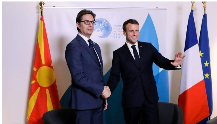
ESI intervju za Alfa TV – februar 2021. godine: Zašto je prijedlog finskog puta za pristupanje EU dobar za Sjevernu Makedoniju