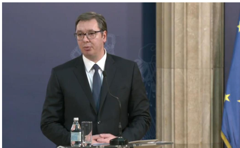
Aleksandar Vučić u Beogradu – 31. januar 2020. godine (na srpskom): "Predsednik Vučić i Borel se obraćaju medijima"

Vlade u Finskoj, Švedskoj i Austriji 1989. godine zaključile su da je ponuda Delorsa u njihovom nacionalnom interesu. Bez ovog interesa EEP nikada ne bi bio stvoren. Pitanje u 2021. godini je da li bi se slična ponuda EU-a mogla ponoviti i bi li to bilo u interesu zemalja zapadnog Balkana: bi li je prihvatile?