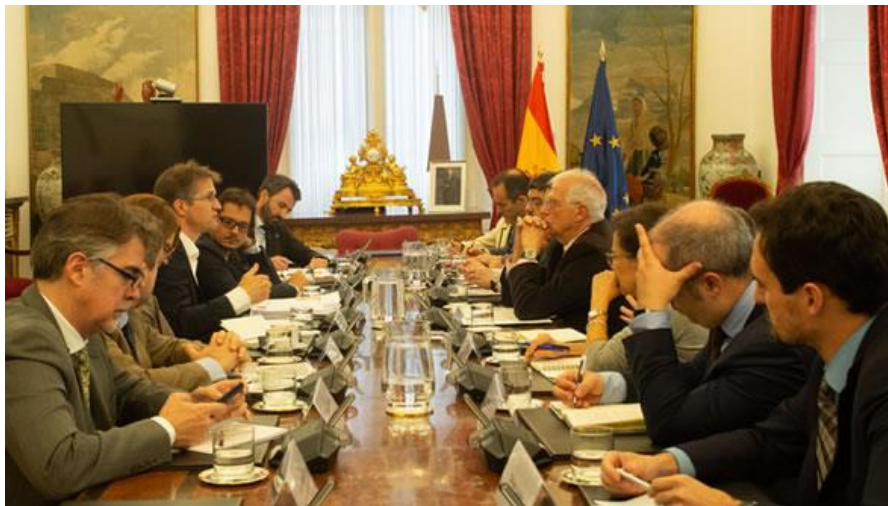
Prezentacija ESI prijedloga u Madridu - novembar 2019. godine

Neue Zürcher Zeitung, Andreas Ernst (Švicarska), " Macron sagt nicht nur Nein – der französische Vorschlag für die Erweiterung der EU " (21. novembar 2019.)