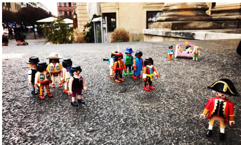
Motivacija je važna: Dječje pitanje i uloga državnih službenika (na engleskom, 8. decembar 2019. godine)

Rumuniji je bilo potrebno od februara 2000. do decembra 2004. da završi svoje pristupne pregovore s Europskom unijom. Srbija, koja je započela pregovore o pridruživanju 2014. godine, sigurno bi trebala biti u stanju dovršiti potrebne reforme za pridruživanje jedinstvenom tržištu EU u roku od nekoliko godina. Isto bi trebale biti i Crna Gora, Sjeverna Makedonija i sve ostale zemlje zapadnog Balkana koje su voljne usredotočiti se na to kao prioritet svoje nacionalne politike u narednim godinama.