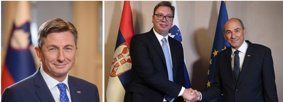
Predsjednici Borut Pahor i Aleksandar Vučić – premijer Janez Janša

Prethodno slovensko predsjedavanje EU 2008. godine odigralo je ključnu ulogu u postizanju kompromisa kako bi se došlo do meritokratskog procesa liberalizacije viza za zapadni Balkan. To je okončalo godine frustracija i podjela po tom pitanju unutar EU i dovelo je do toga da su svi građani zapadnog Balkana (osim Kosova) do kraja 2010. mogli putovati bez viza u EU. To je bio veliki uspjeh slovenske diplomacije.