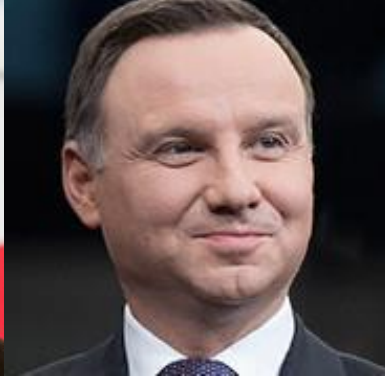
Başkan Andrzej Duda