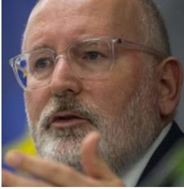
Komisyon Başkan Yardımcısı