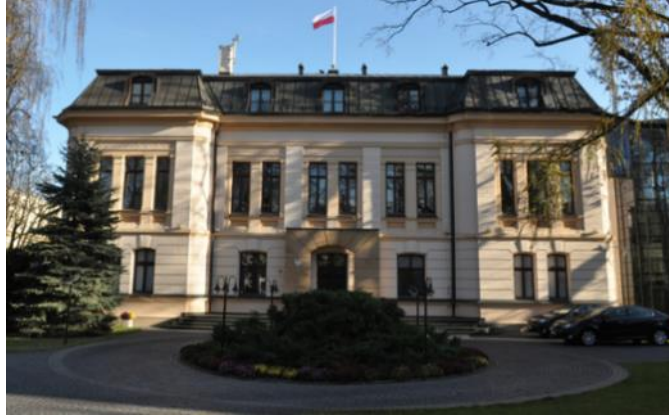
15 üyeli Polonya Anayasa Mahkemesi