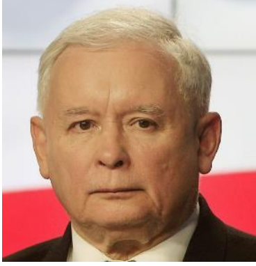
Parti Başkanı (PiS) Jarosław Kaczyński