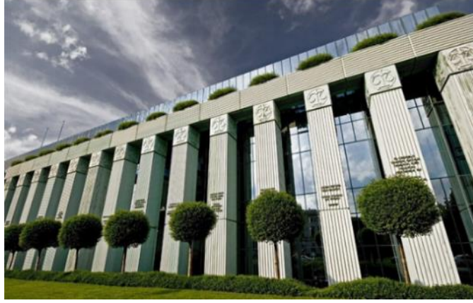
Şimdi 81 üyesi olan Polonya Yüksek Mahkemesi