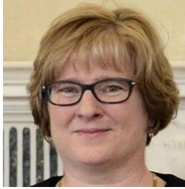
İrlanda Yüksek Mahkemesi Hâkimi