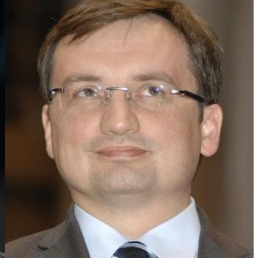
Adalet Bakanı Zbigniew Ziobro